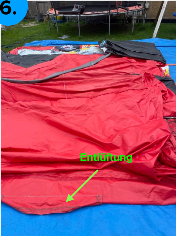
Ansicht von linker Seite