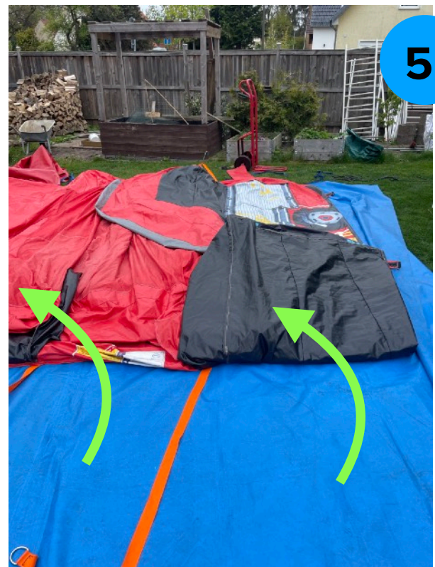
5. Eingang und Rutschenauslauf einklappen