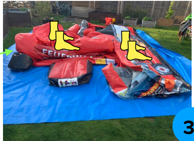
3. Das Ablassen der Luft durch austreten unterstützen.