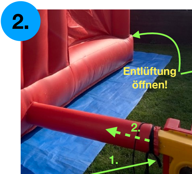
2. Gebläse ausschalten und Gebläseschlauch entfernen. Entlüftung auf der linken Seite öffnen!