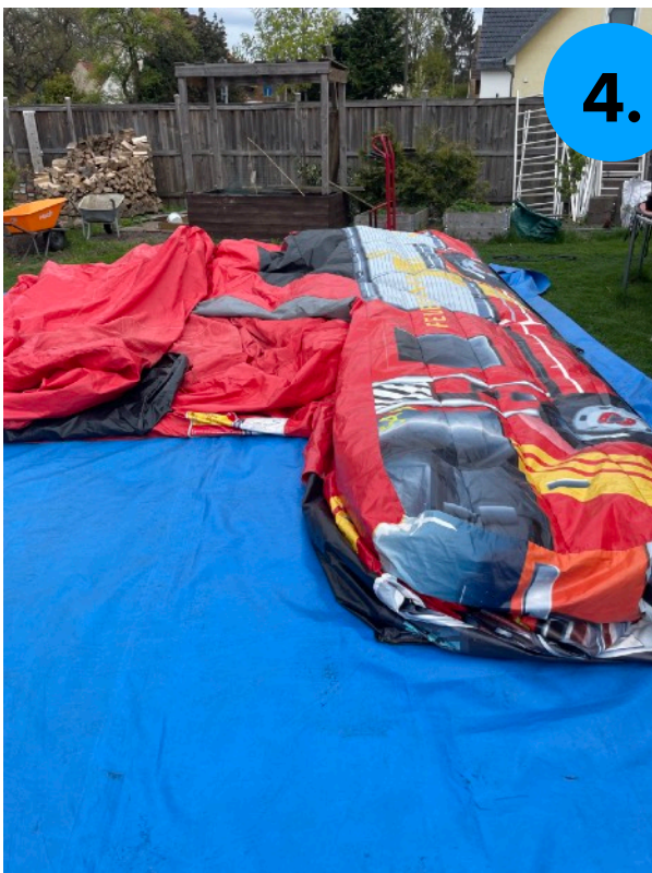
4. Entlüftete Hüpfburg durch ziehen den Materials möglichst flach hinlegen.