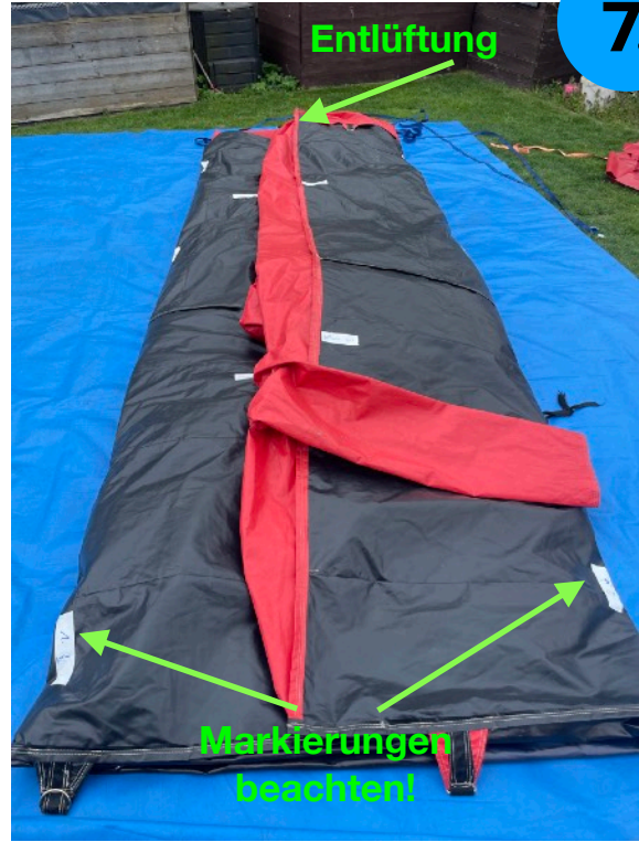
Ansicht von rechter Seite

Hüpfburg wie dargestellt bis zu den Markierungen falten.